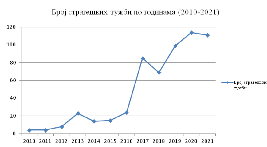
Графикон 2. Кретање стратешких тужби по годинама

посматраним државама (графикон 2). 39 Графикон јасно показује тренд сталног повећања броја стратешких тужби у овом периоду. Штавише, већ је речено да је током 2022. године додато још око 160 тужби (CASE, 2023), што представља највеће повећање у односу на претходне године.